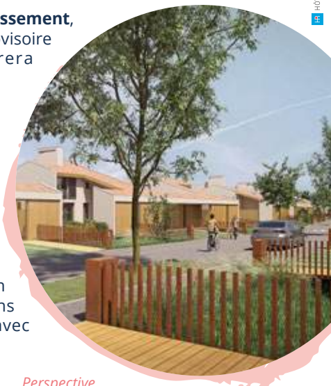
Perspective de la résidence Passerelles

Démarrage des travaux de construction de la résidence « Passerelles » (Lots 3 - 6) des promoteurs NOVILIS et ECLISSE, pour une durée de 18 mois. En parallèle, Oppidea terminera la voie Gisèle Halimi pour que la finalisation des travaux coïncide avec la livraison des logements. La rue définitive sera à sens unique (impasse Malet → rue Piquepeyre) avec un contre sens vélo.